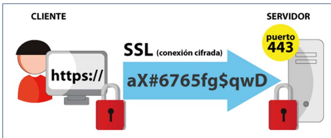
Ilustración 4: Ejemplo de conexión SSL

Es necesario que el sitio web posea un certificado de clave pública válido y correctamente firmado por una Autoridad Certificadora. Es el navegador quien se encarga de comprobarlo. Una vez se ha establecido la comunicación segura, los datos se envían cifrados al servidor hasta el cierre de la conexión.