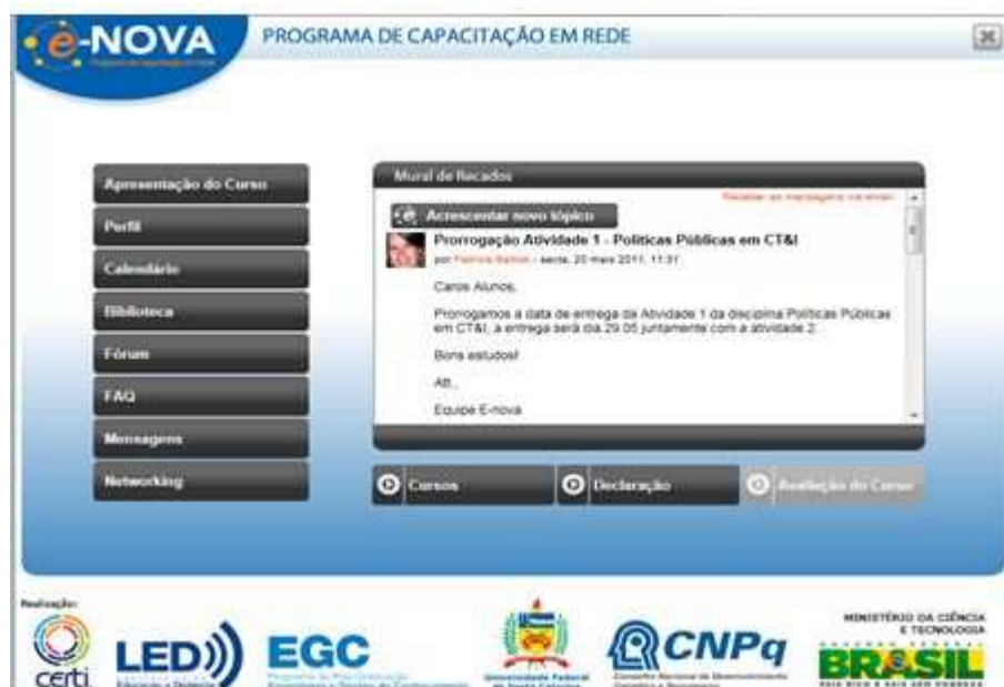
Figura 3 - Ambiente Virtual de Aprendizagem do e-Nova