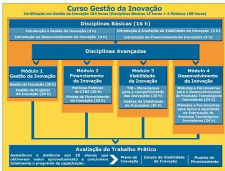
Figura 2 - Matriz curricular

tempo a seu favor. Por este motivo, cursos a distância exigem uma metodologia robusta, ferramentas de gestão de conteúdos e infraestrutura tecnológica apropriada de forma a atender as necessidades do curso. Para tal, o projeto busca a disseminação do empreendedorismo inovador e a geração de produtos e processos inovadores com sucesso técnico e mercadológico. Conta com uma equipe de professores conteudistas, mestres e doutores com grande experiência em gestão de projetos de inovação, e um sistema de tutoria, mestrands e doutorandos do Programa de Pós-Graduação em Engenharia e Gestão do Conhecimento da Universidade Federal de Santa Catarina (UFSC). Com duração prevista de 10 meses o curso é oferecido gratuitamente a empreendedores e potenciais empreendedores de base tecnológica e está organizado em um módulo introdutório e quatro módulos específicos, totalizando uma carga horária total de 184 horas, conforme ilustrado na Figura 2.